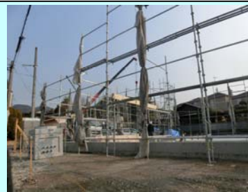
物件名：池田バプテスト教会建替え工事 住 所：大阪府池田市上池田1丁目407

◆◆◆順調に進んでおります教会建替え工事ですが、牧師館・教会堂共に先行足場を架け終え、3月上旬には建方を迎える予定です。最近では珍しく、お施主様の主催で上棟式も執り行って下さるとの事で楽しみでも有り、また、気が引き締まる思いでございます。引き続き安全に注意をし、作業を進めて参ります◆◆◆