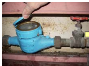
水道メーター凍結

です。給水設備の破裂や破損は集合住宅の場合階下への漏水事故に繋がりますので、注意が必要です。大阪では1月25日に最低気温が氷点下3.5℃という厳しい寒さを迎えました。弊社管理物件でもメーターが破損漏水し、階下に水漏れを生じさせるという事故が有りました。右写真はその復旧作業を行っている模様です。対策としては保温材や発泡スチロールを配管やメーターに巻く事等があります。気温の変化の激しい冬場には、こまめに天気予報等で気温をチェックする事も重要です☆