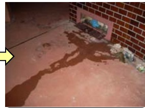
メーターガラス部より漏水