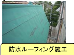
防水ルーフィング施工