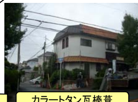
カラートタン瓦棒葺

☆☆☆木材は水分や湿気による腐朽、劣化という弱点が有り、雨漏りは木造住宅には致命的な欠陥になり兼ねません。そこで木造住宅の屋根は、雨漏りを防ぐという大切な役割を担っております。また、屋根は外壁や外部開口部建具廻りからの漏水を未然に防ぐ役割も果たしており、吹き降りの雨水の侵入を防ぐ為の庇の配置等も重要です。右写真は先日お客様ご自宅の軒部分が崩落し復旧させて頂いたものです。雨水の浸透等により軒先下地木枠が腐朽化し、瓦の重さに耐えられず崩落。数100キロは有る瓦が落下しました。幸い怪我人等は出ず最悪の事態にはなりませんでした。軒先を修復するだけでも費用はばかになりませんので、防水工事を定期的に行う事は重要ですね☆☆☆