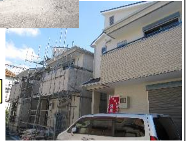
原田元町分譲3区画

☆三共テクニカにて施工させて頂いております工事の進捗状況をご報告致します。仮称箕輪ハイツは基礎工事が終わり、鉄骨の架構に取り掛かるところです。原田元町3丁目分譲3区画は建物部が完成し残すは外構のみとなっております。完成が楽しみです☆