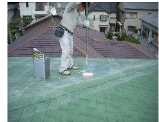
アクリルシリコン系防水材塗布

【ハイツ竹仙】 豊中市服部本町2丁目 鉄筋コンクリート造 ルーフィング葺 3階建・昭和62年築 賃貸マンション