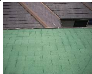
ルーフィング部に亀裂が発生

☆近年、集中豪雨で降雨の範囲が非常に狭く、また降雨時間が短いにもかかわらず単位時間あたりの降雨量が非常に多い、いわゆるゲリラ豪雨(局地的豪雨)が各地で多発するようになりました。これは、地球温暖化により日本の気候が亜熱帯化している事や、都市部でのヒートアイランド現象が関係しているといわれております。弊社で管理させて頂いております物件でもゲリラ豪雨時に雨漏りや浸水などの被害が発生するようになり、ここ数年、夏場などはこの対応に追われる事が多くなってきました。右写真は8月のゲリラ豪雨時や昨月の台風18号において雨漏り被害の発生したマンション屋根部の補修写真です。老朽化したルーフィング部の小さな亀裂部から漏水しておりました。本来はルーフィングを葺き替える等の大掛かりな処置が必要ですが、工事金額が高額になる事もあり、今回は表面にアクリルシリコン系の防水材を塗布し防水層を新たに形成させるという工法を採用致しました。無事雨漏りは止まりましたが、災害はいつ発生するかわかりませんので引き続きメンテナンスに力を入れて頂きたく思います。☆