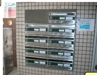
☆新設し綺麗になりました☆