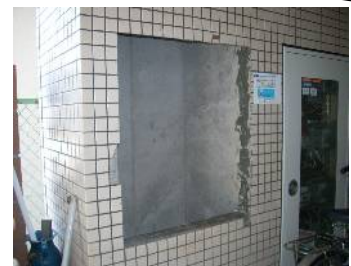
既存ポストを撤去・下地調整