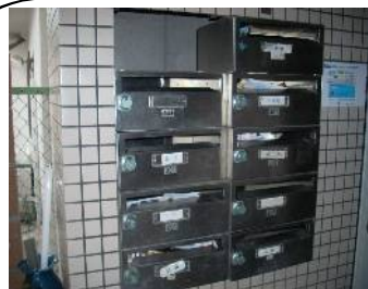
表面の腐食が目立ちます

☆☆☆エントランスに設置された集合ポストはマンションの顔であり、美観に大きな影響を与える共用設備です。これが古びた状態ですと、入居者や来訪者のマンションに対する印象が悪くなってしまいます。右写真は豊中市蛍池東町1丁目に所在する賃貸マンション(ドムール蛍池)の集合ポストを交換させて頂いたものです。設置後約25年が経過し、ダイヤル錠が回りにくくなっていたり、ラッチ部分が腐食し開閉が困難になる等の症状が発生しておりました。また、表面の傷やへこみにより美観への影響も有りオーナー様が交換の決断を成されました。真新しくなったポストに入居者の方々も満足されているに違いありませんね☆☆☆