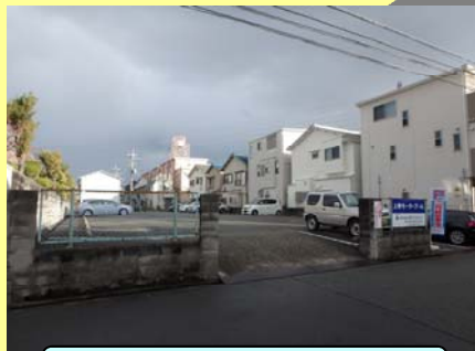
上野モータープール