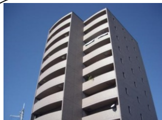
ローレル・ウイングス ハウステック管理物件 H11・8テクニカ施工物件

☆駐車場出入口に設置されているチェーン式ゲートは不特定の車両が駐車場内に侵入するのを抑止し、不法駐車や場内での事故を未然に防止する為に設置されます。また、領域性も確保でき、盗難等の防犯対策にもなります。居住者が出入りする際に、リモコンで操作する事でチェーンが昇降するシステムですが、機械の為、定期的な保守点検と修理が必要となります。この度、豊中市蛸池西町2丁目にある【ローレルウイングス】の新築時に設置されたチェーン式ゲートの修理を行わせて頂きました。今回、センサーの故障により車両が通過した事を機械が感知せず、チェーンが上昇せずそのままになるという状態が頻りに発生し、多数の苦情が有りましたので主にセンサー部の取替えを行いました。機械設備は耐用年数にかかわらず突然故障する事が有りますので、事前に損耗部品の取替えを行う事で突発的な事故に対応する事も一つの管理方法ですね☆