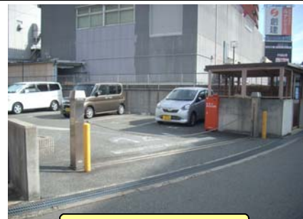
チェーン式ゲート