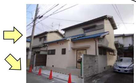
ブロック塀を取り除き駐車スペース造作

工事内容【駐車スペース造作、和室を洋室改装、キッチン交換、洗面所拡張、塗装、外溝工事等】