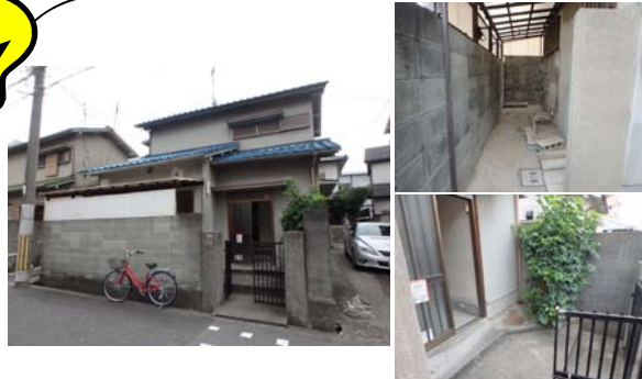
建物道路側にブロック塀・内側に室外洗濯機置場有り

☆☆☆昨月、豊中市中桜塚3丁目に所在する借家の大規模な改修工事を行わせて頂きました。工事内容の目玉は駐車スペースの造作です。借家賃貸物件もここ最近、郊外を中心に増えて参りましたが、築年数の新しい物件には必ずと言っていい程、駐車場が付設されております。本物件には駐車場が無く、他物件に比べて利便的に劣ってしまいます。そこで、今回、賃借人が退去する事に併せて、御施主様のご要望の元、工事を実施させて頂きました。工事完成後はブロック塀が無くなりすっきりとした美観です。また、この付近の青空駐車場賃料相場は月額15,000円程ですので賃料もその分UPする事が出来ました☆☆☆