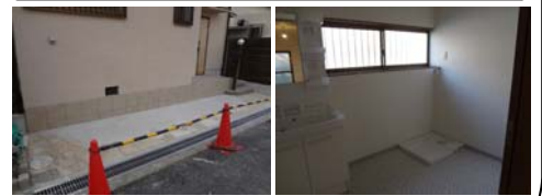
洗面所を拡張し洗濯機置場を造作