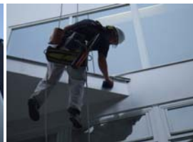
☆作業風景・5月19日実施☆