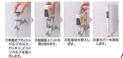
①手動式フラッシュバルブのふた、バックピンを取り外します。 ②取替ユニットを取り付けます。 ③乾電池を挿入します。 ④前カバーを固定します。

乾電池式ですから電源工事は一切不要。配管やコネクターの接続などわずらわしい作業はありません。