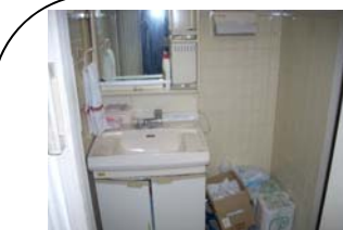
①殆ど使われていない洗面所

☆☆☆大阪市淀川区に所在する明光電機様社屋にて殆ど使用されていない洗面所を男性用トイレに改装させて頂き、小便器にはセンサー感知により自動で洗浄を行うシステムを設置させて頂きました。このシステムはフィジック制御により使用頻度や使用時間をセンサーが感知し、効率的な水量を確保することが出来ます。また、長時間使用者がいない場合でも、設備保護機能により24時間間隔で自動的に洗浄し、小便器のトラップと排水管の乾きを防ぎ悪臭や害虫対策にも効果があります。設置は乾電池式の為、電気配線工事は必要なくすぐ行え、また既存の便器に取り付けられているフラッシュバルブでも取付が可能な場合であれば工事費用も安価で行うことが出来ます。ご自宅の改装の際等は是非ご検討されては如何でしょうか。是非弊社まで御相談下さいませ☆☆☆