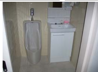
③便器・洗面台取付完成☆

【明光電機様社屋】 大阪市淀川区 三津屋3丁目 鉄骨ALC造・5階建 築後25年程経過