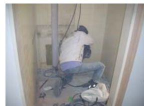
②洗面台撤去・配管工事