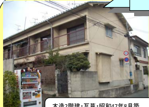
木造2階建・瓦葺・昭和47年8月築 阪急宝塚線「岡町駅」徒歩13分