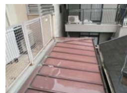
増築部と既存建物取り合い部