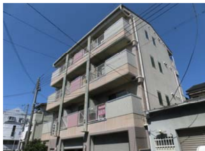
【笹倉マンション】 鉄骨ALC造・4階建 大阪市旭区大宮3丁目 敷地面積: 179.91㎡ 建築面積: 515.64㎡ 築後21年程経過 賃貸マンション

の3つの内容で、特に③の部分の雨漏りは深刻で防水工事に加え増築部の屋根の葺き替え(瓦葺→カラーベスト)も行う予定です。竣工は5月末頃を予定しておりますが、その際は再度ご報告させて頂きます。☆☆☆