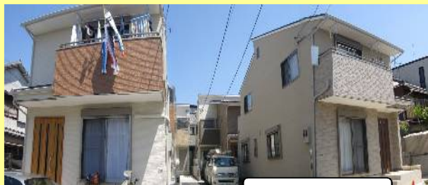
サンスマイル北桜塚分