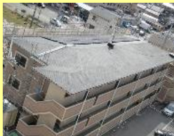
太陽光システム設置