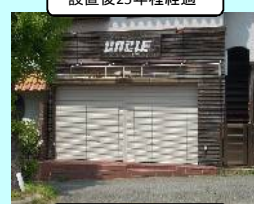
☆綺麗になりました

◆シャッターは長い年月使用していると、ボックス内の巻き上げ用スプリングやシャフト及びスラット部分が雨水等の影響で錆び、開閉が出来なくなったり、美観が悪くなったりする為、定期的なメンテナンスが必要です。上写真は老朽化したシャッターのスラット(出し入れする部分)を交換させて頂いた現場写真です◆