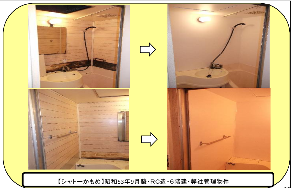
【シャワーかめめ】昭和53年9月築・RC造・6階建・弊社管理物件

水回りに清潔感が出ると入居者には喜ばれますので、古くなったユニットバスに是非御検討下さいませ。☆