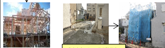
豊中市島江町2丁目分譲戸建