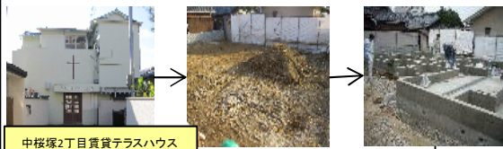
中桜塚2丁目賃貸テラスハウス

難波駅まで徒歩圏内の好立地の為、単身層に人気のマンションですが、完成後の内覧者からの反響が楽しみです。完成後写真は次号以降に掲載致します。☆