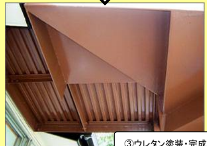
③ウレタン塗装・完成!