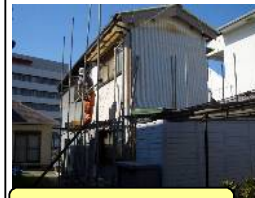
①壁・屋根が老朽化

土地所有者様の資産活用の一環として、豊中市中桜塚2丁目に所在するキリスト教会を取り壊し、賃貸テラスハウス(木造2階建て、3LDK、総戸数3)建築の御注文を頂きました。有難うございます。解体工事は12月初旬から開始し、完成は来年3月中旬を予定しております。中桜塚は特にファミリー層に人気のエリアです。阪急「岡町」駅から徒歩6分、豊中市役所や商店街もすぐ近くの好立地で、完成する前から入居希望者様からの反響が楽しみです♪ 建物が完成しましたら、ご報告させていただきます☆