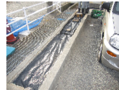
(株)J-COM宝塚川西局 H23.11.28実施